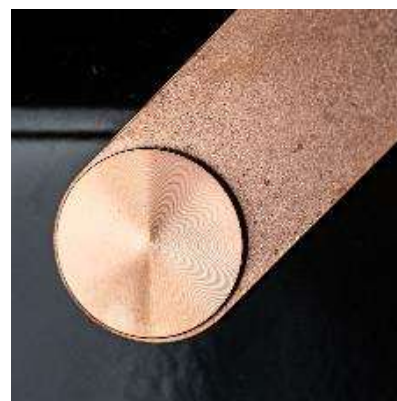
DESIGNBÜGEL aus Kupfer