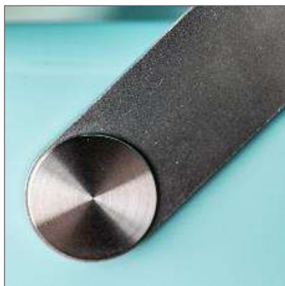
DESIGNBÜGEL aus Stahl